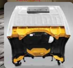
Penambahan anti karat pada cabin

NHR55 100PS TURBO INTERCOOLER TANGGUH & EFISIEN